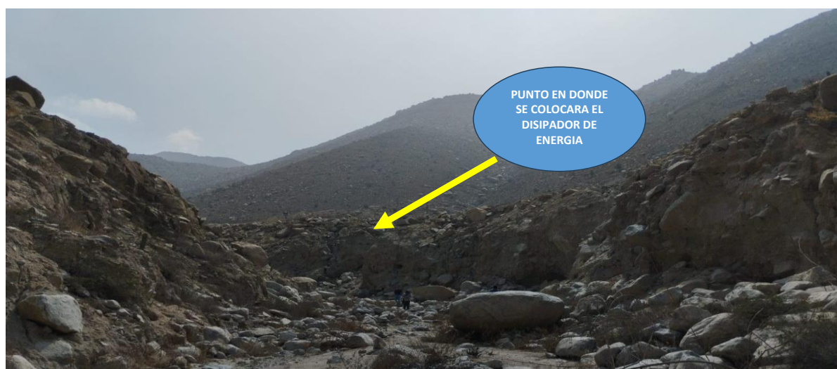
SECTOR QUEBRADA - PASCANAIII